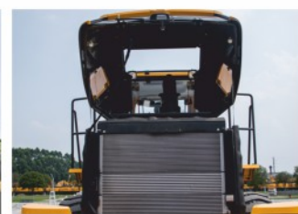
Опрокидывающийся капот двигателя упрощает проведение ТО