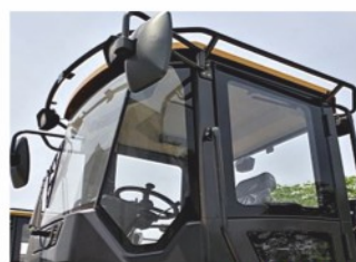
Эргономичная кабина (ROPS-FOPS) имеет обзор на 360°, установлены поручни по всей кабине