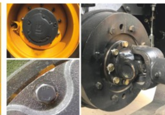
Специальные болты класса прочности 10.9