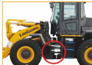
Вал расположен выше шарнирно-сочлененного соединения