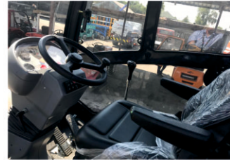
Удобное и эргономичное кресло