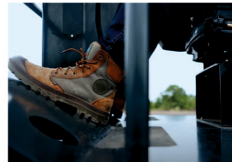
Около нулевой вибрационная нагрузка на оператора