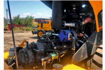
Опрокидывающийся капот двигателя