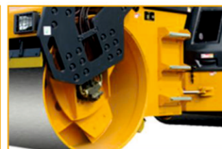
Бесступенчатое изменение скорости, отсутствие частого переключения сцепления, удобная и эффективная работа