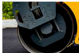
Возможность работать в высокочастотном режиме 67 Гц.