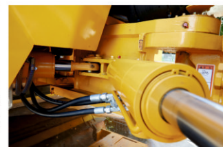
Опция смещения валцов относительно друг друга в стороны на 160 мм