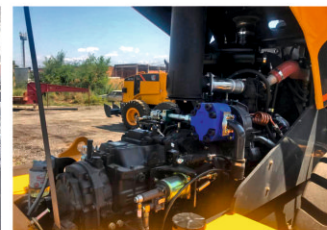
Опрокидывающийся капот двигателя