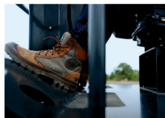
Около нулевой вибрационная нагрузка на оператора