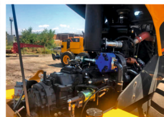
Опрокидывающийся капот двигателя