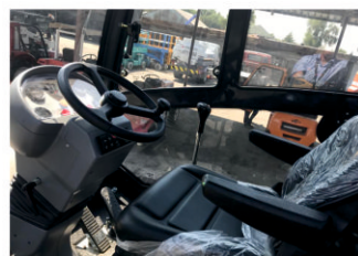
Удобное и эргономичное кресло