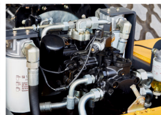
Простой и надежный двигатель Shangchai SC4H140.2G2