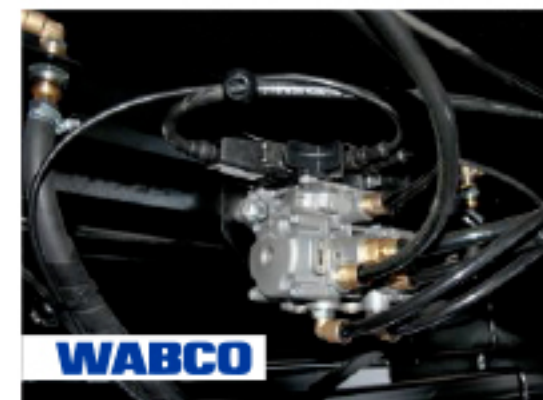
Рабочая тормозная система - WABCO , пневматическая, двухконтурный привод раздельно к тормозам передних и задних колес, тормозные механизмы барабанного типа на всех колесах, ABS .