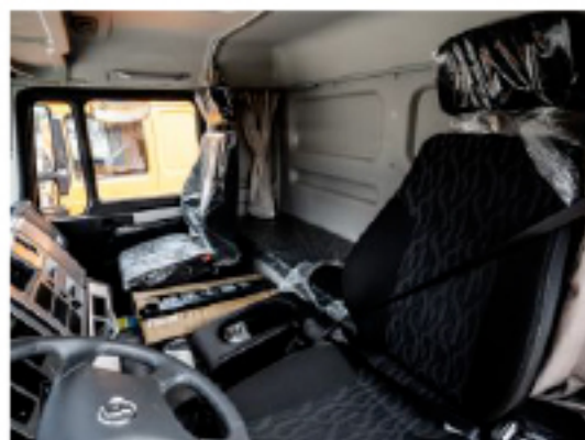
Комфортная и просторная кабина, изготовленная по технологии MAN