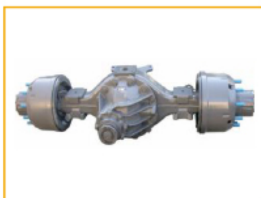
Передняя ось: 7,5T MAN , зависимая, балансирующая на полуэллиптических рессорах. Задняя ось: 16T MAN , зависимая, на продольно расположенных полуэллиптических рессорах, с телескопическими амортизаторами.)