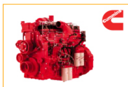
Двигатель CUMMINS с отличной топливной экономичностью среди всех производителей силовых установок. 30 000 часов непрерывного стресс-тестирования подтверждают надежность и эффективность двигателя QSK19