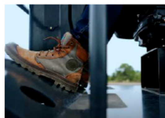
Около нулевой вибрационная нагрузка на оператора