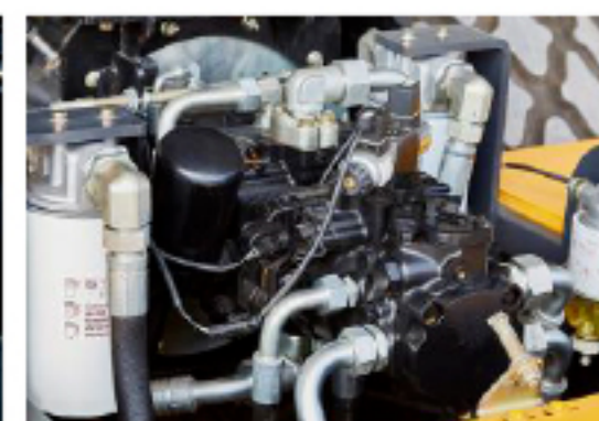
Простой и надежный двигатель Shangchai SC4H140.2G2