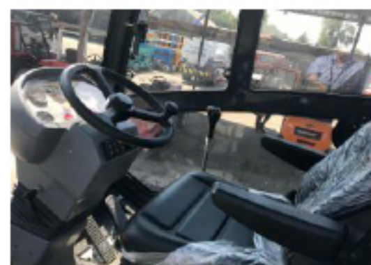
Удобное и эргономичное кресло