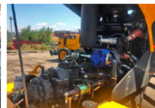
Опрокидывающийся капот двигателя