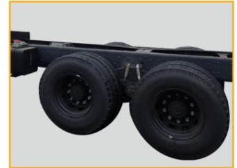
Шасси изготовлена по технологии тяжелой автомобильной техники MAN (Германия).