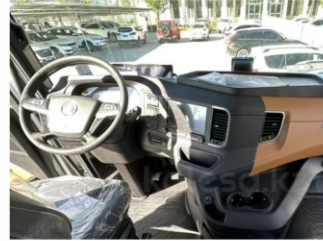
Комфортная и просторная кабина, изготовленная по технологии MAN