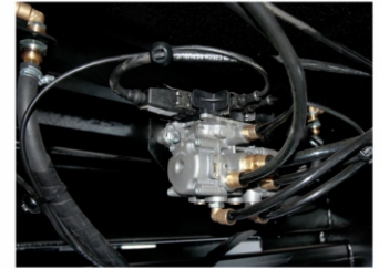
Рабочая тормозная система - WABCO , пневматическая, двухконтурный привод раздельно к тормозам передних и задних колес, тормозные механизмы барабанного типа на всех колесах, ABS .