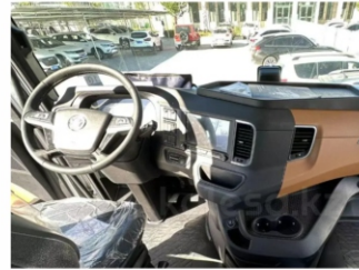
Комфортная и просторная кабина, изготовленная по технологии MAN