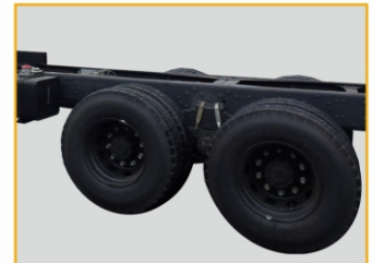
Шасси изготовлена по технологии тяжелой автомобильной техники MAN (Германия).