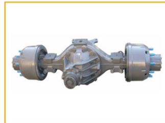
Передняя ось: 7,5T MAN , зависимая, балансирующая на полуэллиптических рессорах. Задняя ось: 16T MAN , зависимая, на продольно расположенных полуэллиптических рессорах, с телескопическими амортизаторами.