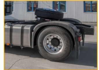
Шасси изготовлена по технологии тяжелой автомобильной техники MAN (Германия).