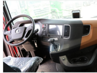
Комфортная и просторная кабина, изготовленная по технологии MAN